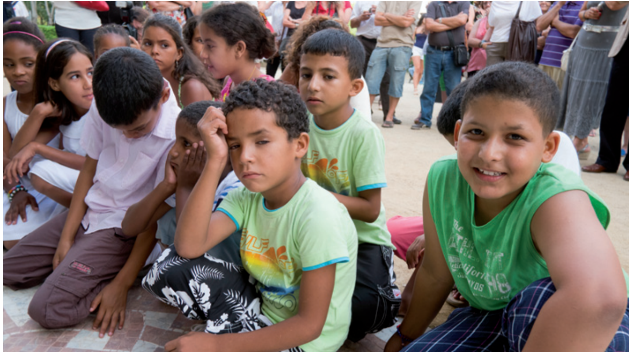
Nens i nenes sahrauís que van ser acollits per famílies de L'H l'estiu passat