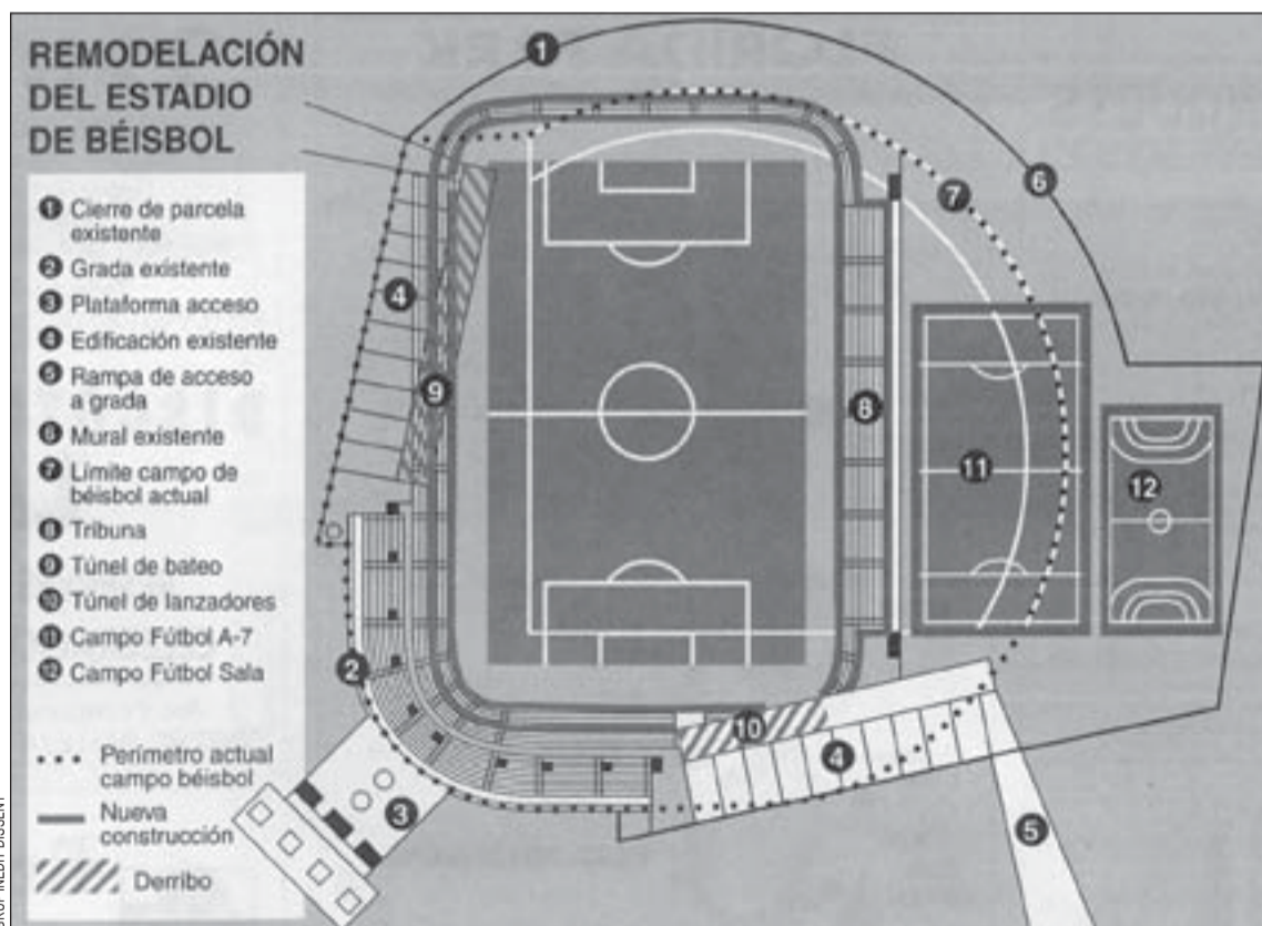
Este plano dibuja los cambios que experimentará el equipamiento deportivo

tar la capacidad del campo, podrían instalarse gradas supletorias para superar los 6.000 espectadores.