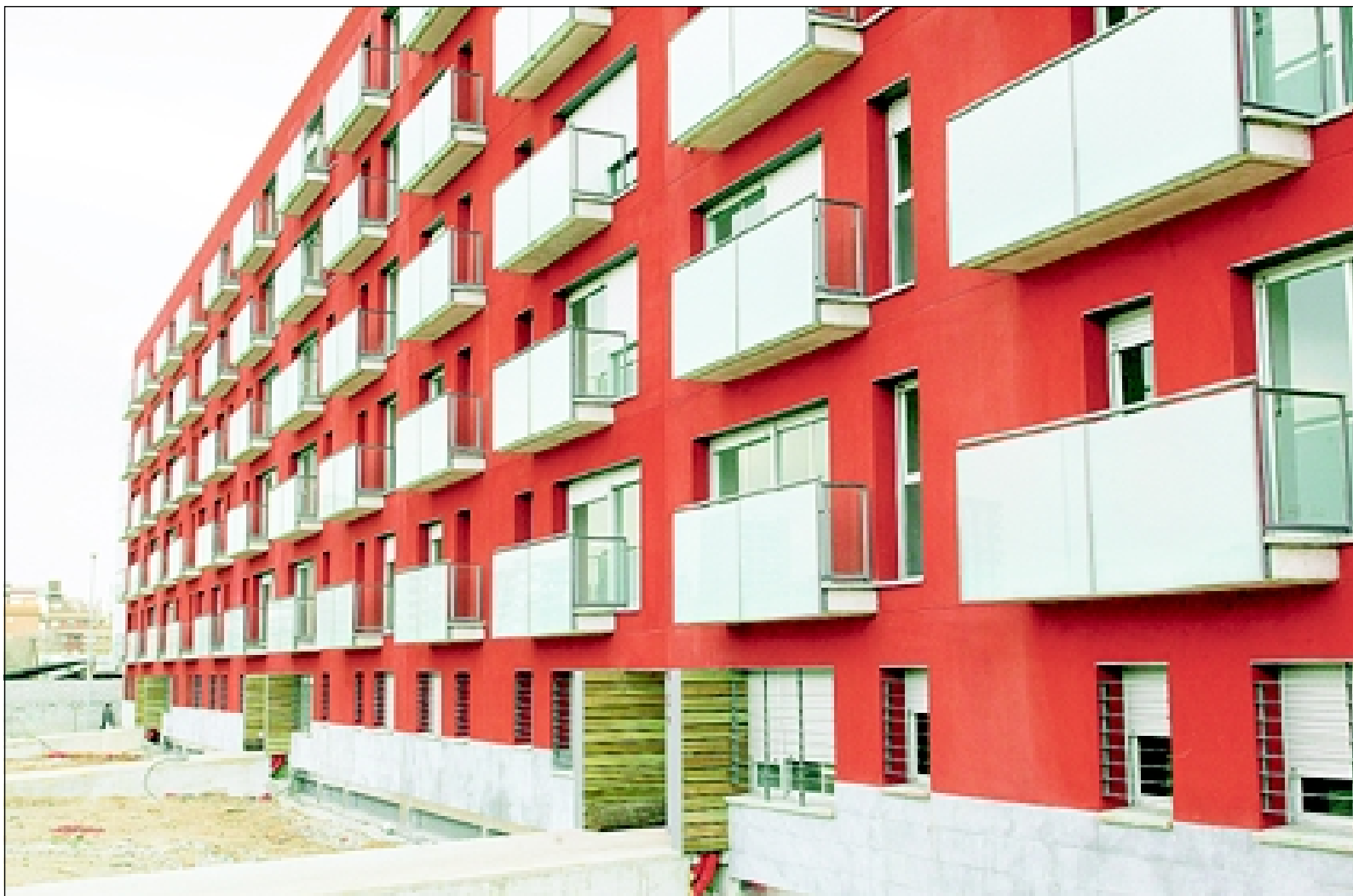
Viviendas tuteladas en el Gornal de la asociación de trabajadores de la Seat y la Fundación Pere Mitjans