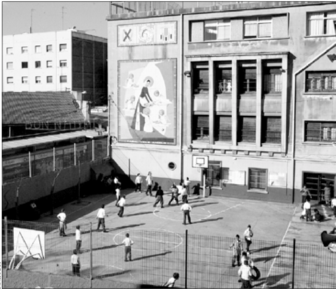
La mañana del 19 de noviembre, el centro educativo recuperó la normalidad