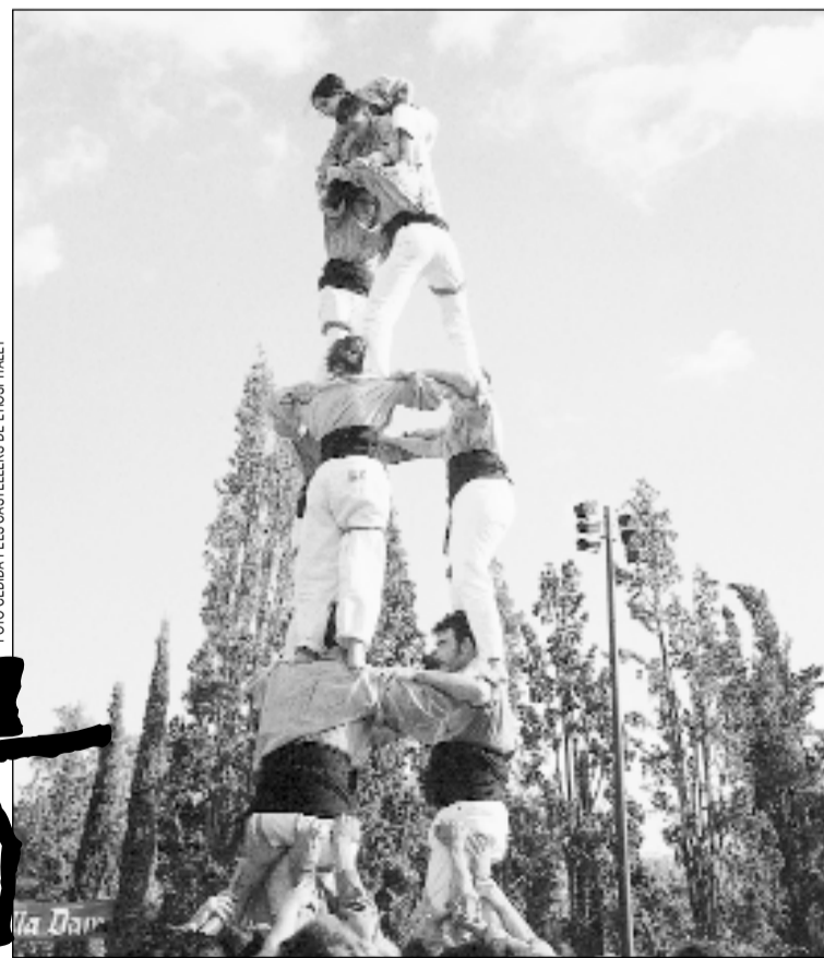
Los Castelleros de L'Hospitalet participarán en esta muestra

La muestra L'Hospitalet escenario de culturas quiere ofrecer también una pequeña representación culinaria. El sábado, y antes de las 20h, tendrá lugar una degustación de queimada , preparada por la Casa Galega de L'Hospitalet. El domingo, poco antes de las 20.30h, los presentes en La Farga podrán probar algunos pos-