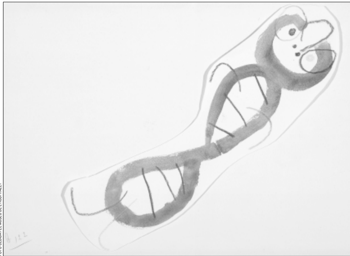
Enfance d'Ubu, realitzat el 1953 per Joan Miró, una de les peces que integren el fons d'art local