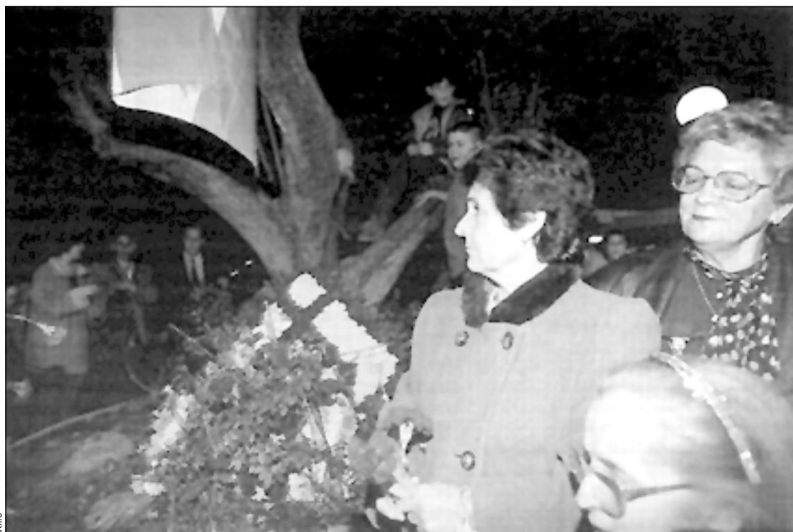
La ofrenda floral en el monumento a Blas Infante en la edición del año pasado de la semana cultural