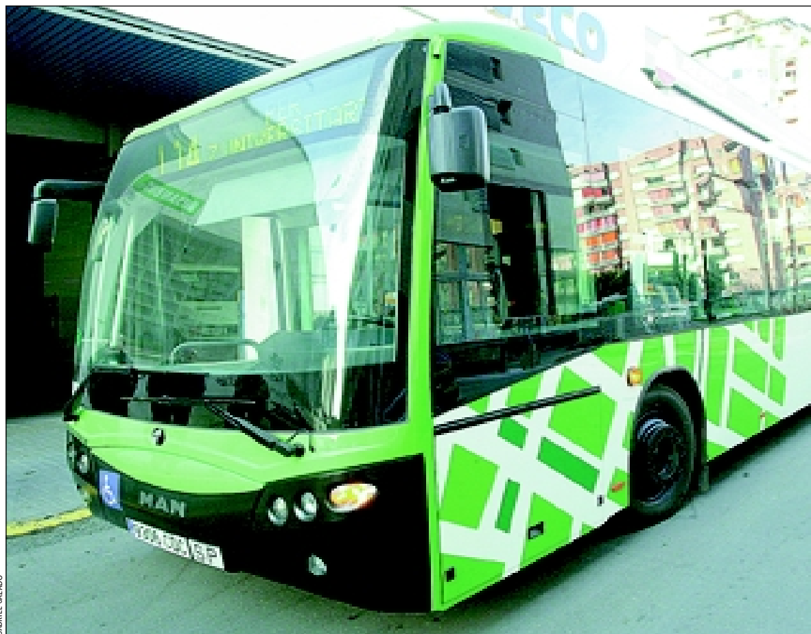
L'Hospitalet ha millorat el servei d'autobusos i ha incorporat nous vehicles

La L9 resoldrà un dels actuals problemes de la ciutat, la connexió amb el districte econòmic Granvia L'H i el seu entorn on es construeixen la Ciutat de la Justí-