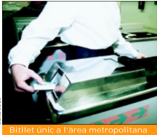
Bitllet únic a l'àrea metropolitana

El nou sistema implantat també comporta l'augment dels punts