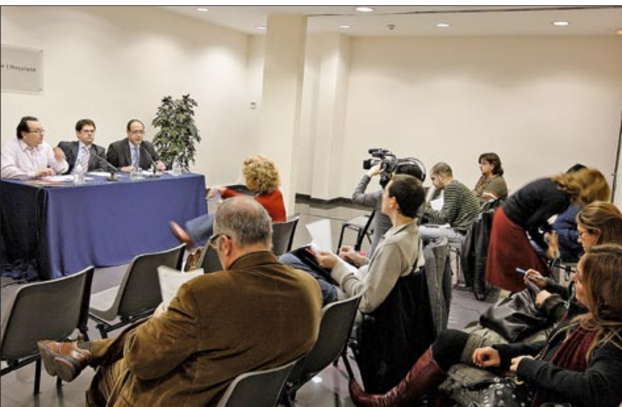
Presentación del barómetro 2007 en el Ayuntamiento de L'Hospitalet

Las novedades de este barómetro son que se ha entrevistado a personas extranjeras y que se ha incorporado una pregunta sobre el principal problema personal de los ciudadanos