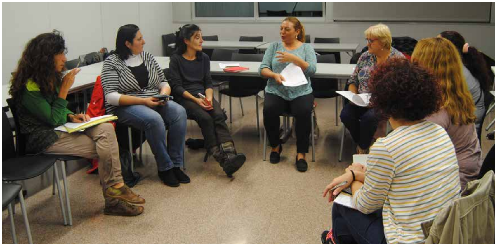
La primera trobada del curs 2018/19 va tenir lloc al Centre Cultural Bellvitge-Gornal