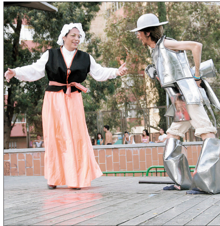
Imatges de les festes majors de la Florida i el Gornal de l'any passat