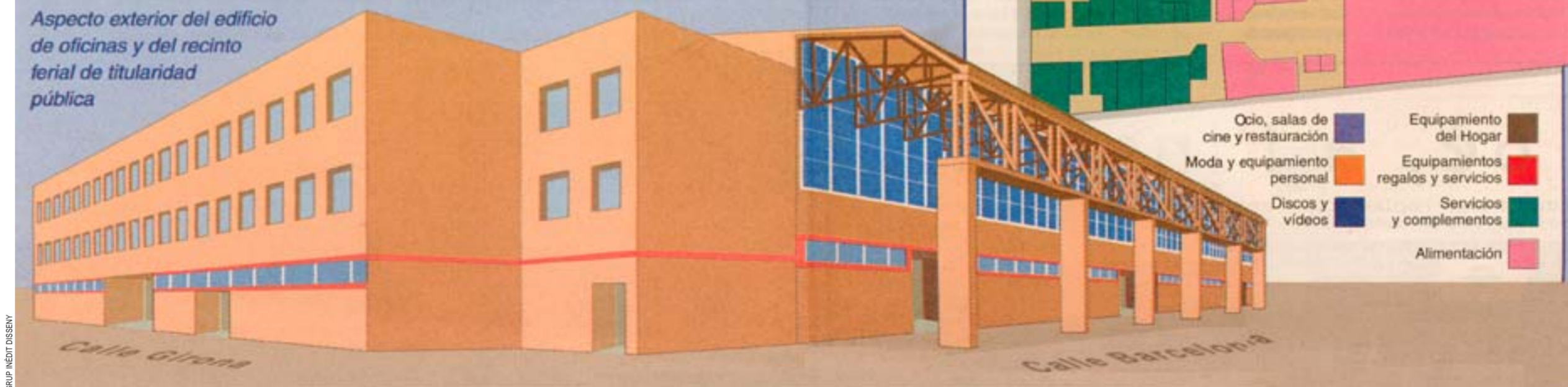
Aspecto exterior del edificio de oficinas y del recinto ferial de titularidad pública