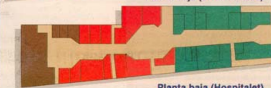
Planta baja (Hospitalet)