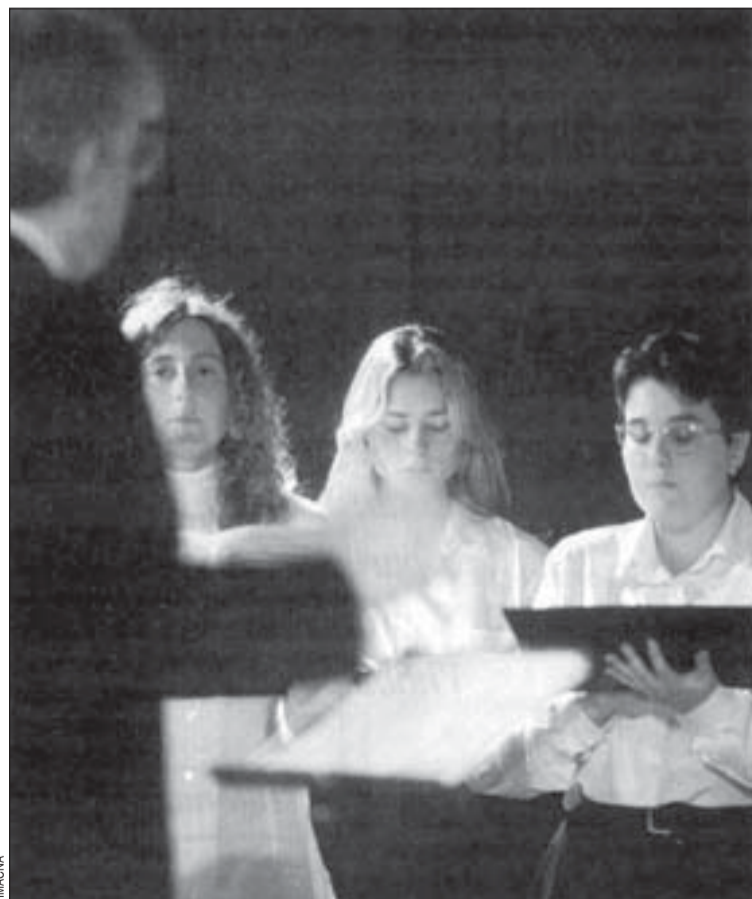
La Setmana de Cant Coral ha destacat per la participació juvenil

En aquesta edició de la Setmana de Cant Coral també han tingut especial incidència les corals ju-