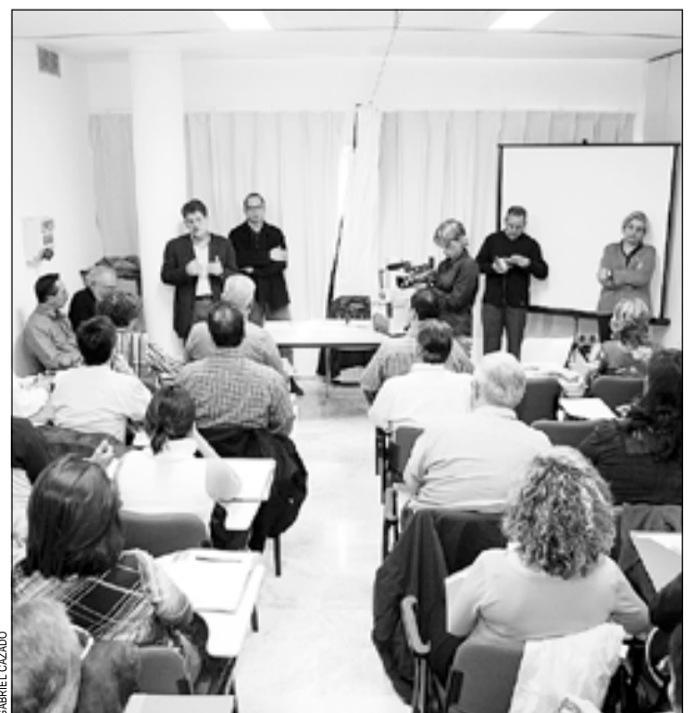
Primer curs destinat a les entitats, a La Bòbila

Aquests cursos es realitzen en col·laboració amb el Pacte Local per a l'Ocupació i l'Àrea de Promoció Econòmica i estan cofinançats per la xarxa de municipis de la Diputació de Barcelona. # REDACCIÓ