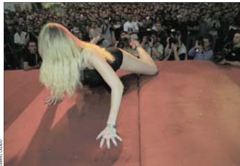
Una de las actuaciones de la pasada edición

escenario principal que acogerá los mejores espectáculos eróticos y también stands con productos de los sectores relacionados con el mundo del sexo. En el