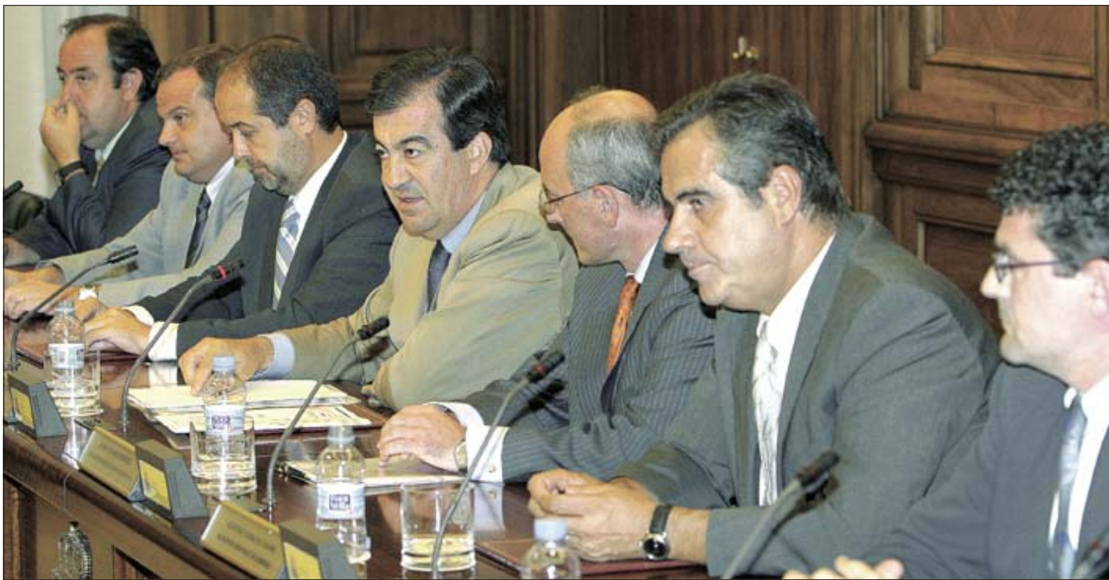
El acuerdo sobre el trazado se firmó el 25 de julio en el Ministerio de Fomento