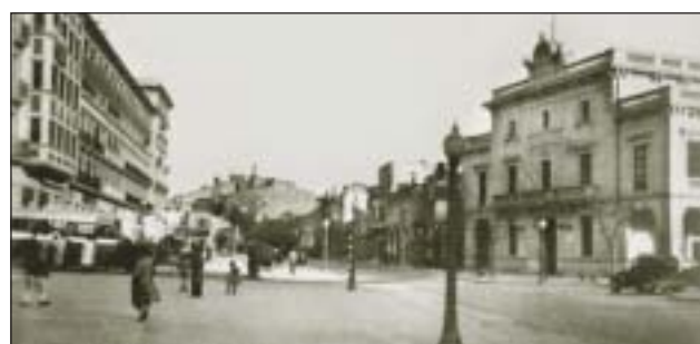
Canal de la Infanta (1919), fàbrica de sedes Can Vilumara (1907), estació de tren de L'Hospitalet (1962) i plaça de l'Ajuntament a la dècada dels 50

PUBLICACIONS El llibre forma part d'una col·lecció que recull la història de Catalunya titulada genèricament L'Abans, Memòria fotogràfica i històrica dels pobles de Catalunya . El volum, dedicat a L'Hospitalet, és una compilació de fotografies i testimonis que cobreix el període entre 1890 i 1965, elaborat per Mireia Mascarell. Ha estat una feina llarga i costosa que s'ha perllongat durant gairebé dos anys, però que finalment ha arribat a la seva fi.