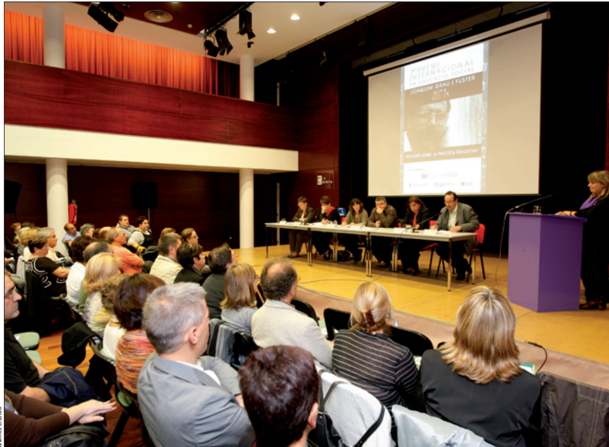
Acte de presentació del I Premi Joaquim Grau i Fuster en Educació Social