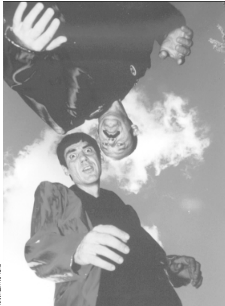
Faemino y Cansado portaran l'humor surrealista al Jovenut

Un altre dels espectacles estrella del cicle és Vides privades , una coproducció del Tricycle del 2 al 4 de març, dirigida per Paco Mir i que retrata la França dels feliços anys 20 . L'obra La millor marihuana