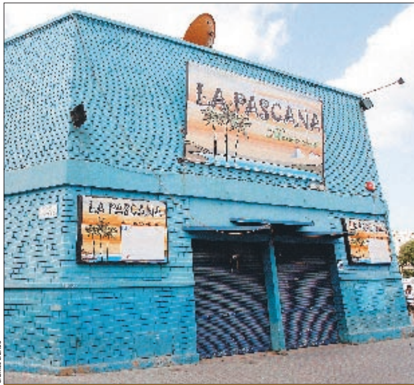
La Pascana lleva cuatro meses cerrada al público