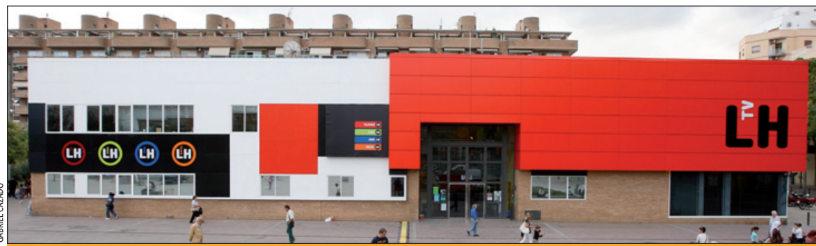
La Cavalcada 2009 sortirà de l'edifici dels mitjans de comunicació