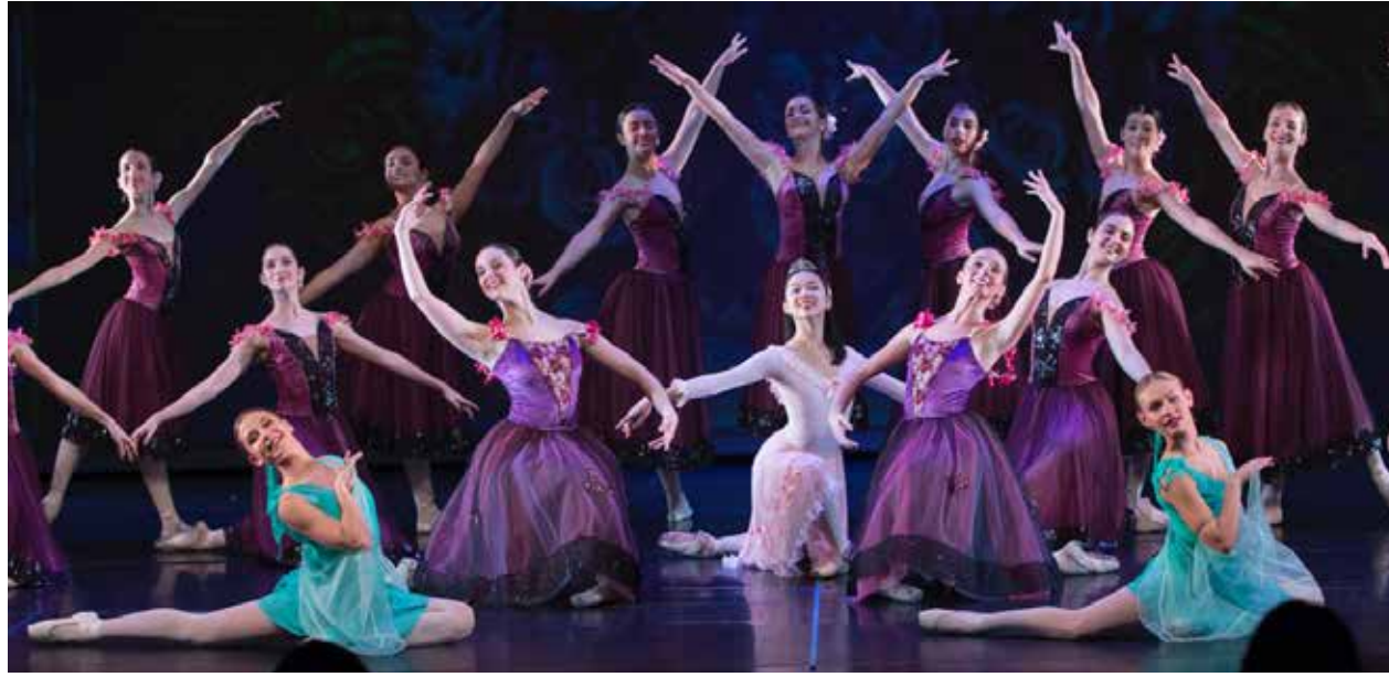
Escena d' El Trencaous , espectacle que el Centre de Dansa representa fa 7 anys al Teatre Jovenut

El centre també produeix espectacles, com ara El Trencaous que fa set anys acull el Teatre Jovenut pels volts de Nadal. Al mateix Jovenut, el 26 de març s'hi representarà per a escoles Quadres d'una exposició , i els dies 11 i 12 de maig, dins del Festival Ciutats en Dansa, veurà l'estrena de Gisele . "Aquests espectacles garanteixen pràcti-