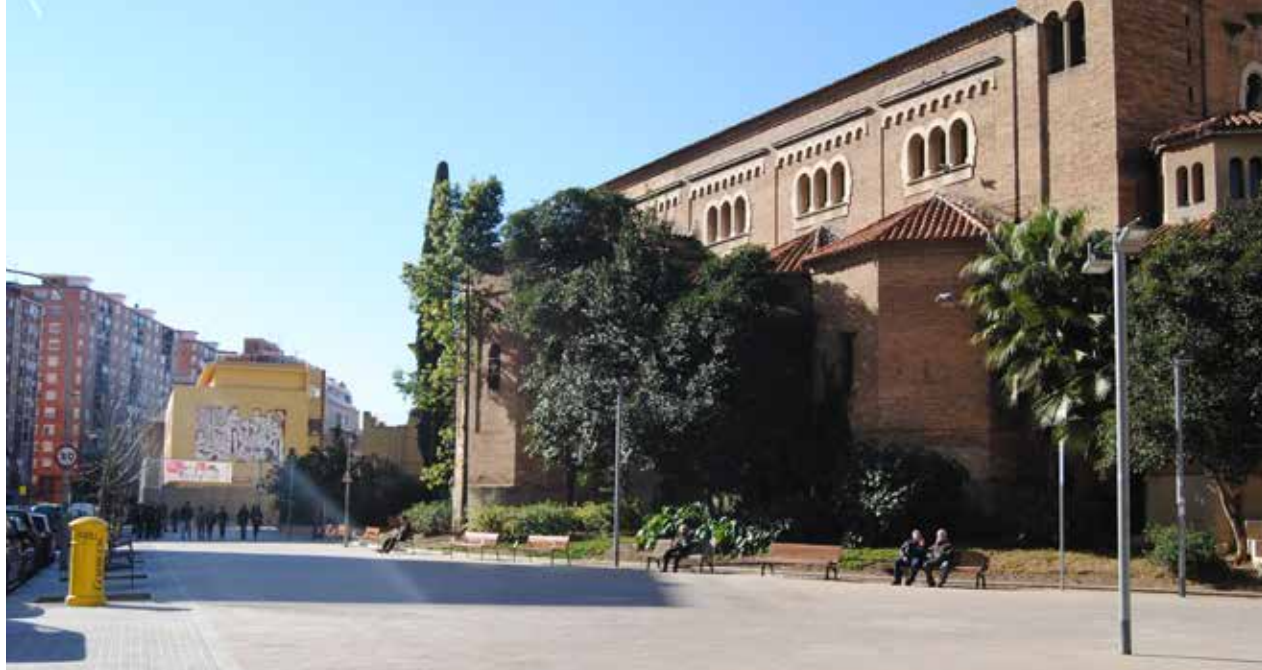
La antigua zona de aparcamiento se ha convertido en un espacio que da continuidad a la plaza de la iglesia

En enero finalizaron las obras de renovación del asfalto y las aceras de la calle Jansana. También se ha intervenido alrededor de la iglesia de Santa Eulàlia de Provençana con la eliminación de un quiosco que estaba cerrado y la supresión de la zona de aparcamiento. La actuación ha dado como resultado un amplio espacio más amable y accesible para los vecinos y los alumnos del centro de secundaria del Casal dels Àngels, dando continuidad a la plaza de la fuente luminosa de enfrente de la iglesia. Igualmente el tramo de vía que conecta Jansana con la calle Santa Eulàlia, frente a la ermita románica, ha pasado a ser de priori-