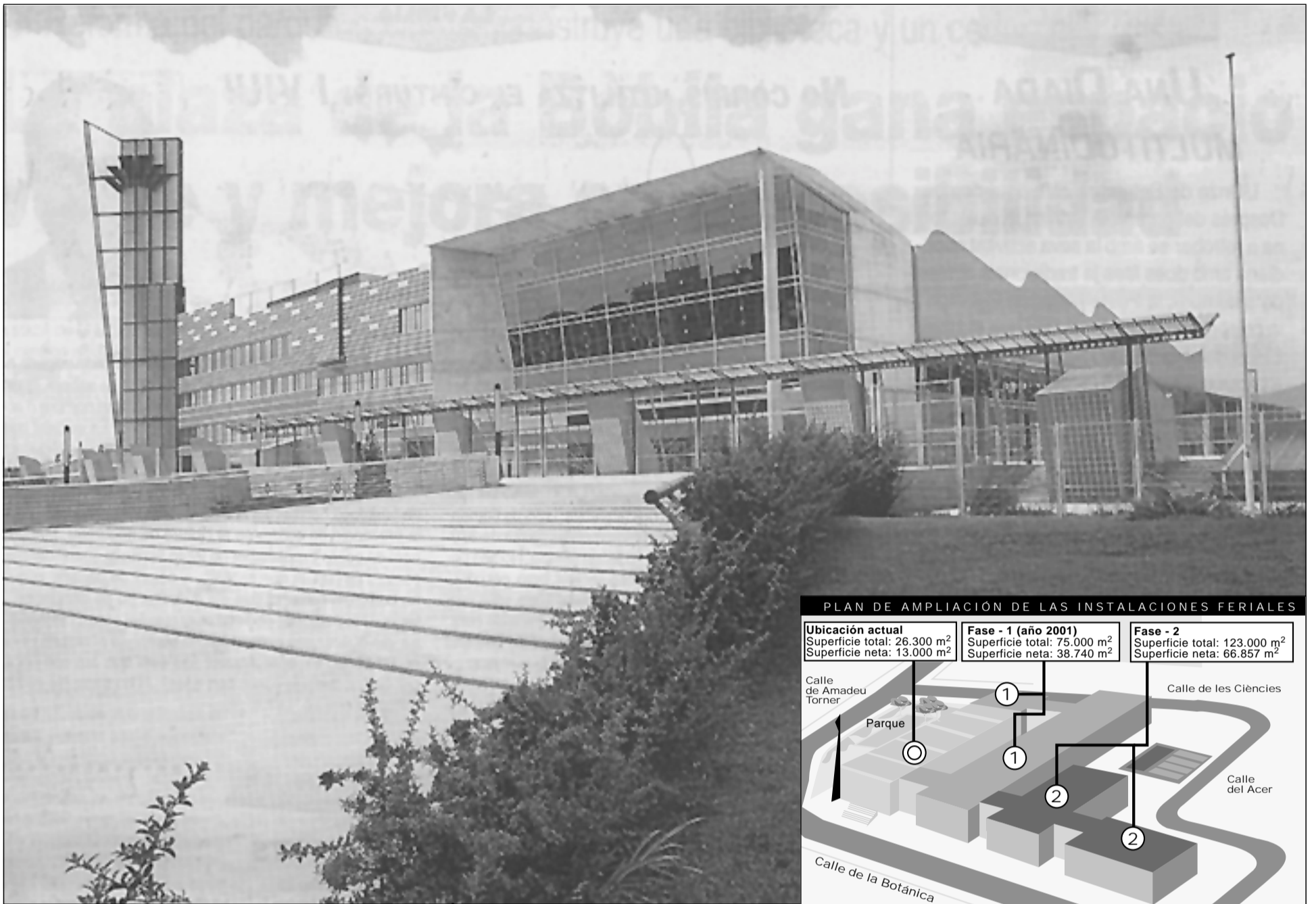
Las instalaciones de Montjuïc-2 ganarán más de 50.000 m 2 de superficie tras la ampliación