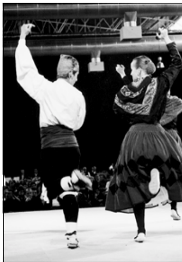
Jotas en La Farga

El próximo 23 de junio el Centro de Actividades La Farga acogerá el III Certamen Nacional de Jota Aragonesa en Catalunya Ciudad de L'Hospitalet. Los participantes pueden hacerlo en las categorías individual (en modalidad de infantil, juvenil y adultos) o de canto (masculino y femenino). Unos días antes, el 15 y el 16, se harán las eliminatorias previas en el Centro Cultural Collblanc-la Torrassa. El jurado está formado en un 90% por personas llegadas de Ara-