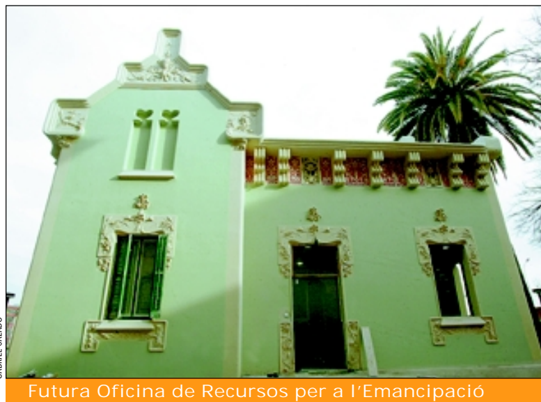
Futura Oficina de Recursos per a l'Emancipació

Els serveis gratuïts que dona a joves de 15 a 35 anys, són: informació, orientació, assessorament, gestió, mediació i seguiment sobre habitatge, ocupació, formació i igualtat. Pel que fa a l'habitatge, assessora sobre compra o lloguer i sobre les condicions per accedir als pisos de lloguer de la borsa d'Habitatge Jove; respecte a l'ocupació es definiran accions que facilitin la re-