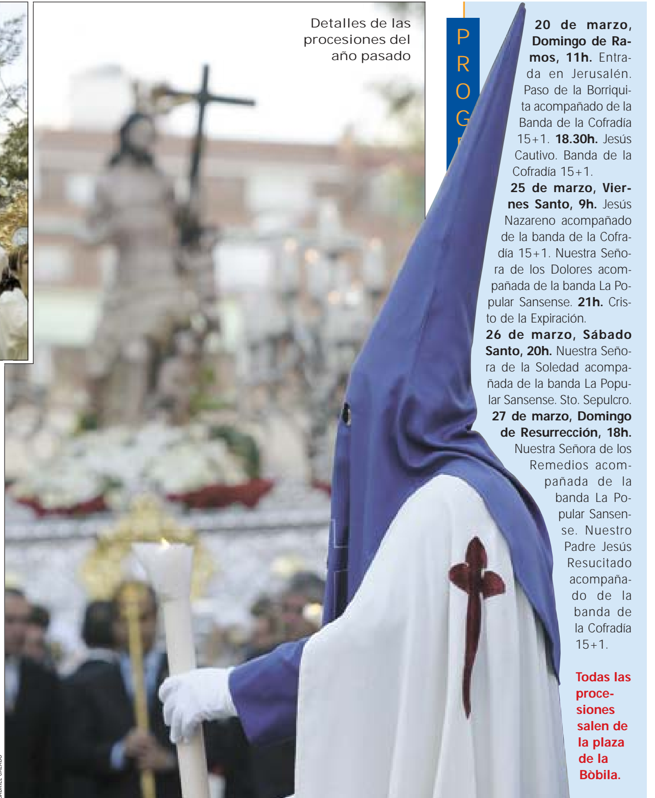
Detalles de las procesiones del año pasado

Para hacer boca y preparar la Semana Santa, la Cofradía 15+1 convocó el día 12 el primer certamen de bandas de cornetas y tambores, con la presencia de 6 grupos de otras tantas poblaciones catalanas. Cada una de las bandas salió de un punto diferente de la ciudad (cercano a Pubilla Casas) para concentrarse en la plaza de la Bòbila. La banda de la cofradía está compuesta por 50 personas, la más joven tiene 8 años y la más mayor, 29. # PILAR GONZALO