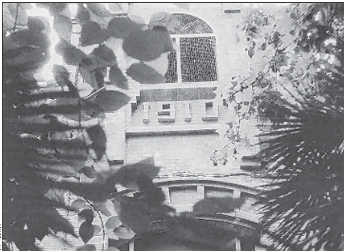
La nave central de la fábrica textil Can Gras será rehabilitada como equipamiento para la ciudad

Este plan, cuyo avance aprobó el Pleno municipal el pasado mes de mayo, ordenará este espa-