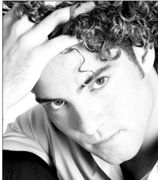
Fotografies de promoció de Chenoa i de David Bisbal

lladar amb la seva família a Palma de Mallorca. Chenoa tenia 12 anys quan va aparèixer per primera vegada dalt d'un escenari. Des dels 16 es dedica professionalment a la música i ja abans d'Operación Triunfo era