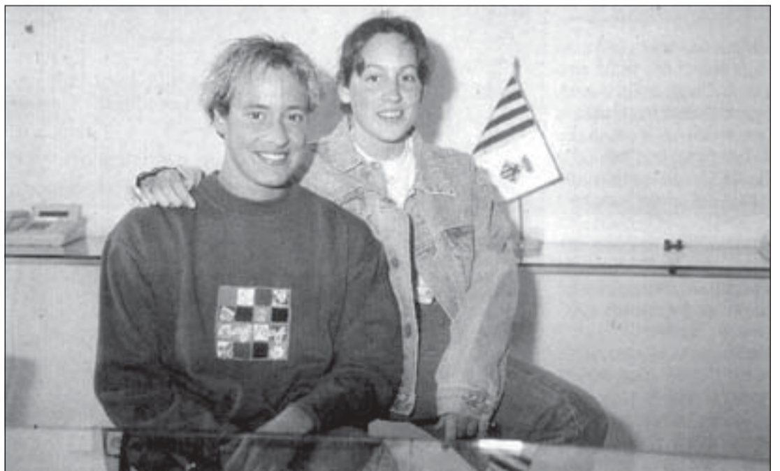
Las dos nadadoras hospitalenses momentos después de la recepción del alcalde al equipo

Ambas deportistas, que junto al resto del equipo fueron recibidas por el alcalde de L'Hospitalet por su actuación en el Cam-