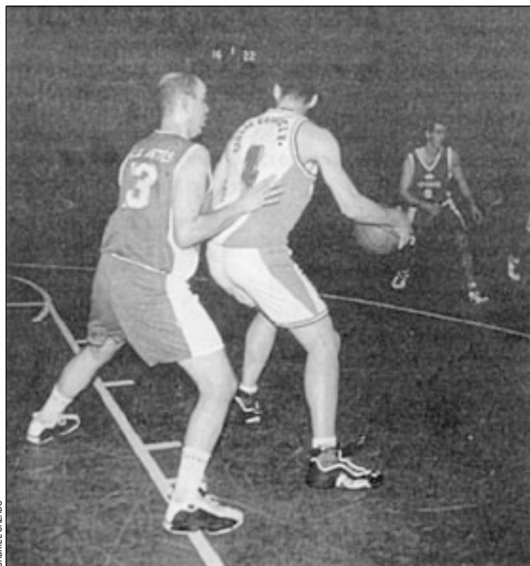
Un momento del encuentro entre Centre Catòlic y Artès