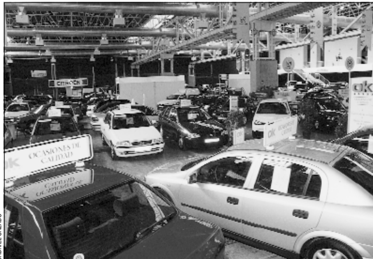
Una imagen de la última edición de Firamotor

La feria está dirigida a profesionales y ofrecerá una amplia gama en vehículos industriales, comerciales, transformados y adaptados. Los interesados dispondrán de condiciones especiales de negociación y financiación especial