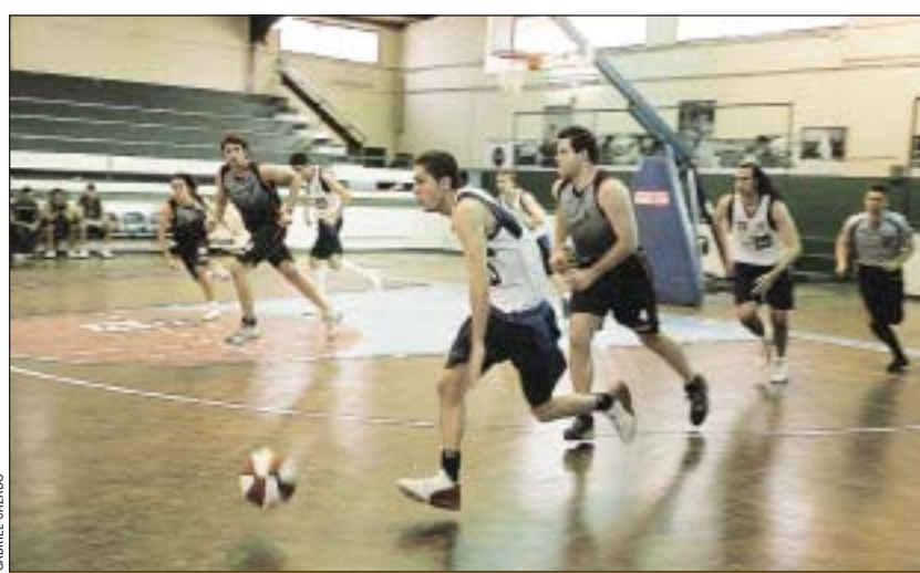
El CB L'Hospitalet B en el pabellón de bàsquet

femení a la ciutat no se sent a parlar fins a principis dels setanta, quan vam ser pioners de la marxa atlètica femenina. Després, la dona es va incorporar plenament a l'esport i a la nostra ciutat diferents clubs com L'H Atletisme han recollit aquesta herència. # ENRIQUE GIL