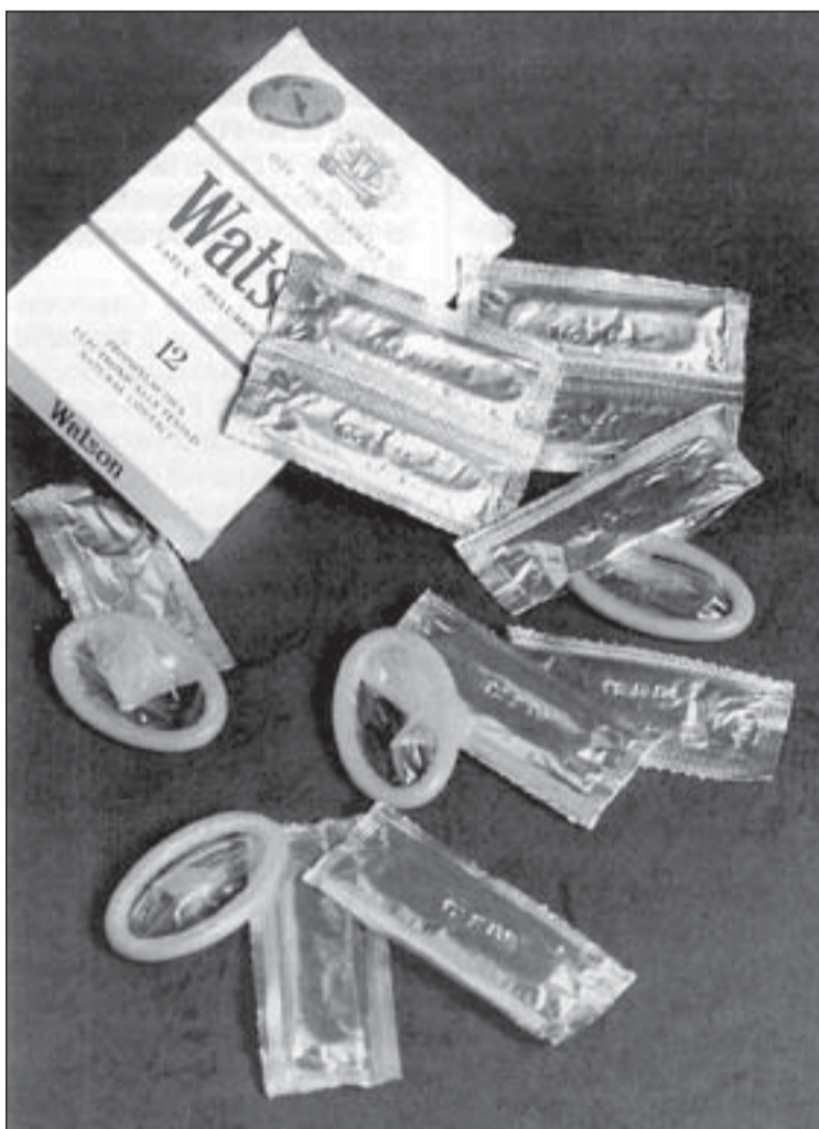
L'ús del preservatiu evita el contagi en les relacions sexuals