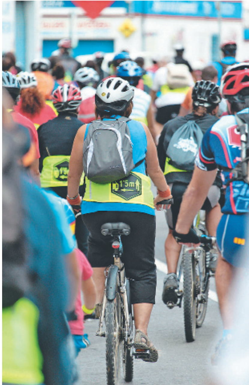
Una de les pedalades de l'edició anterior de la Setmana