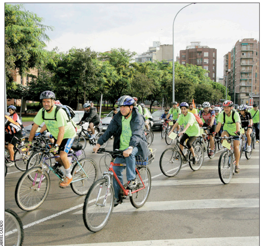
Bicicletada con motivo de la Semana de la Movilidad