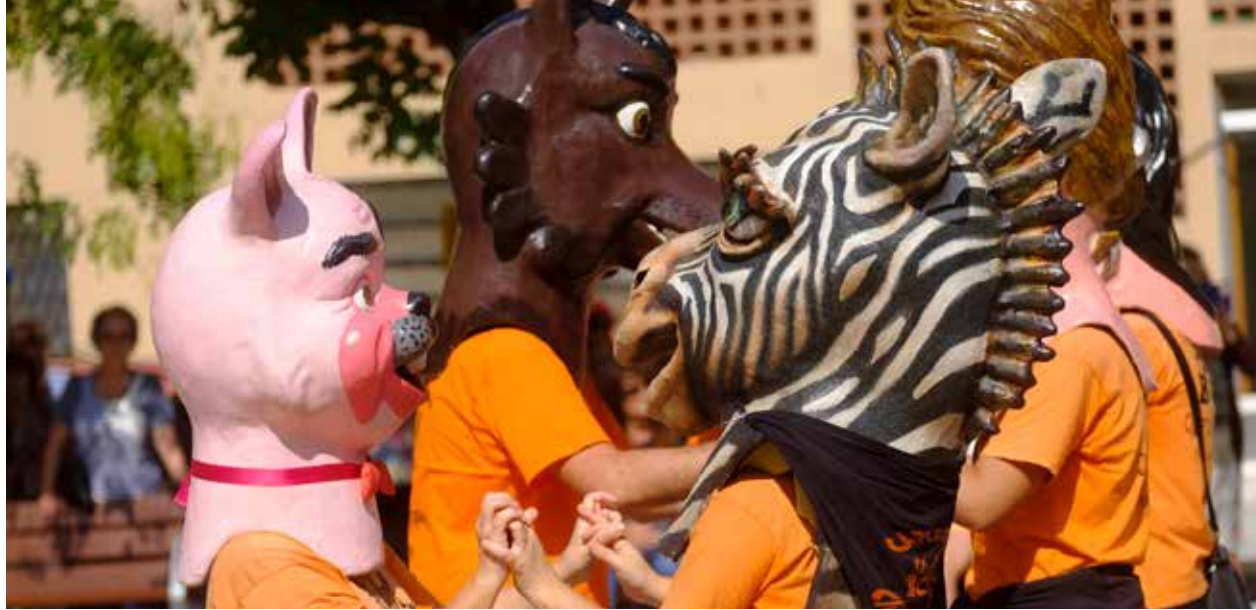
Los Cagrossos de Ciutat Comtal, en la fiesta mayor de 2017

Las fiestas de Ciutat Comtal cierran, como cada año, el ciclo de fiestas de los barrios de L'H. ■