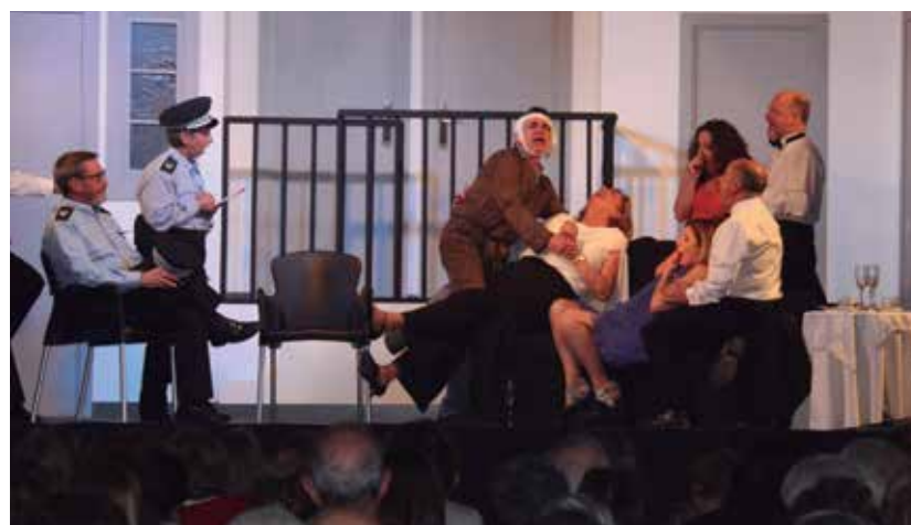
El grup de teatre ha celebrat 10 anys amb l'estrena de l'obra 'Rumors'

drà lloc el dissabte 29 de setembre amb una gran festa de celebració. La festa començarà a les 18h amb l'espectacle de l'il·lusionista Magic Raphael, seguit de l'acte protocol·lari de l'entrega de les ensenyes d'argent als socis i el brindis d'aniversari. Tot seguit l'actuació de la Stromboli Jazz Band donarà pas al sopar de germanor a la sala gran del Casino.