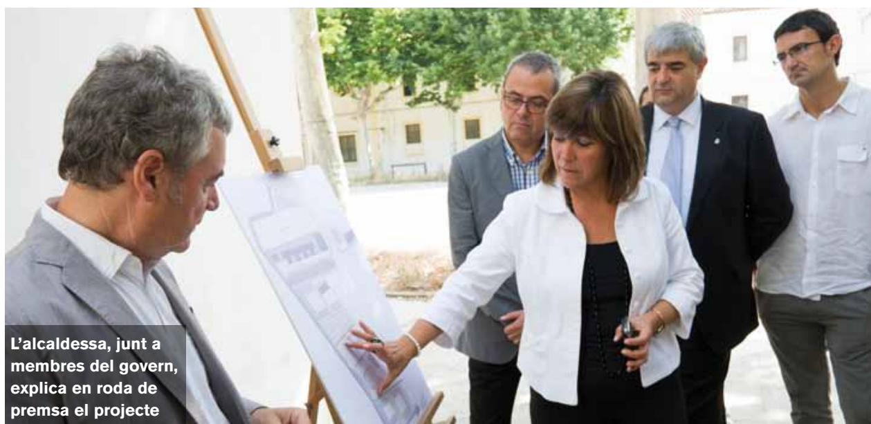
L'alcaldesa, junt a membres del govern, explica en roda de premsa el projecte

El projecte preservarà el traçat del canal de la Infanta, una infraestructura construïda al segle XIX des de Molins de Rei a Barcelona per fer arribar l'aigua del riu Llobregat i que va incidir en la industrialització de la ciutat. A L'Hospitalet en resten uns 250 metres que s'ubiquen darrera l'antiga caserna. El traçat es mantindrà, se n'eliminarà el formigó que l'envolta i l'entorn tindrà un tractament especial per senyalitzar la ubicació. El pontet que el creua serà rehabilitat i es rodejarà d'arbrat i vegetació. Després d'estudiar les restes del canal, la Generalitat va descartar declarar-lo Bé Cultural d'Interès Nacional. Tot i això, l'Ajuntament ha decidit preservar-lo com a part de la història de L'H. La plataforma ciutadana Protegim el canal de la Infanta ha mostrat la seva satisfacció perquè es preservi i vol fer un seguiment de les obres.