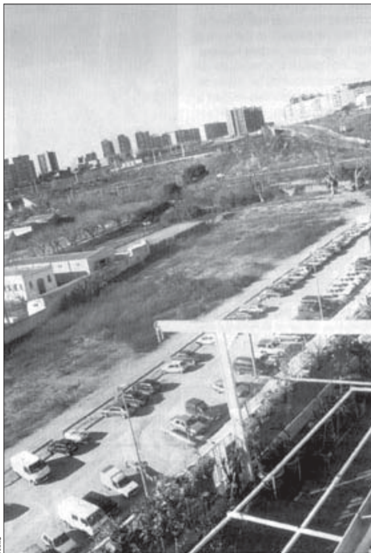
Las nuevas viviendas se construirán en la calle Álvarez de Castro

Suerte diferente corrieron las mociones presentadas por el PP,