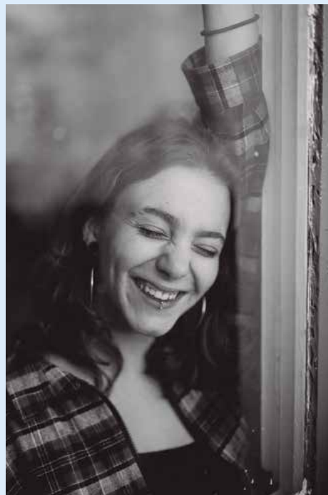
CEDIDES PER L'AUNTAMENT

Concerts a la Remunta. Espectacles gratuïts amb grups i solistes de primer nivell i bandes de la ciutat.