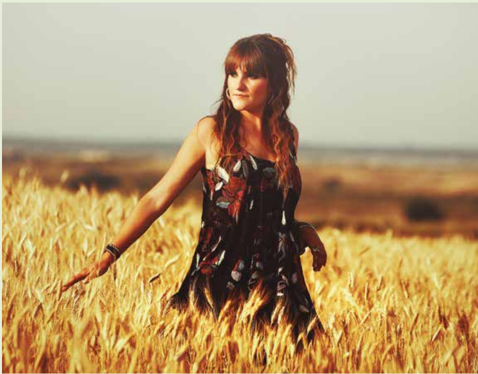
CEDIDES PER L'AUNTAMENT

Amb tres discos d'estudi i un recopilatori en la seva trajectòria, María Rozalén s'ha convertit en un autèntic referent de la cançó d'autor espanyola dels últims anys. Tot un luxe rebre-la a La Farga. Preus: 24 € (anticipada) + despeses de distribució. Venda: entrades.elperiodico.cat www.theproject.es www.atrapalo.com www.ticketea.com www.ticketmaster.es Taquilla de La Farga el dia del concert La Farga (c. de Barcelona, 2)