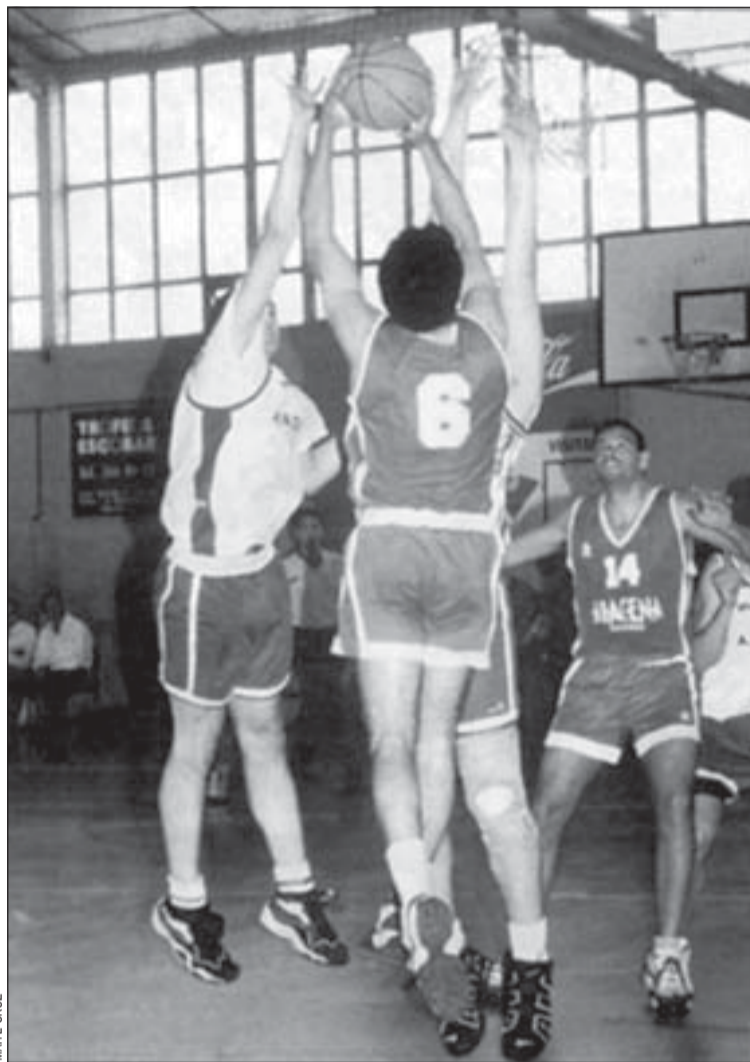
El Aracena es campeón de Catalunya en primera catalana

A un paso de jugar las fases de ascenso a Segunda División se ha quedado el Centre La Torrassa, que ha acabado cuarto en primera catalana. En segunda, el Cen-