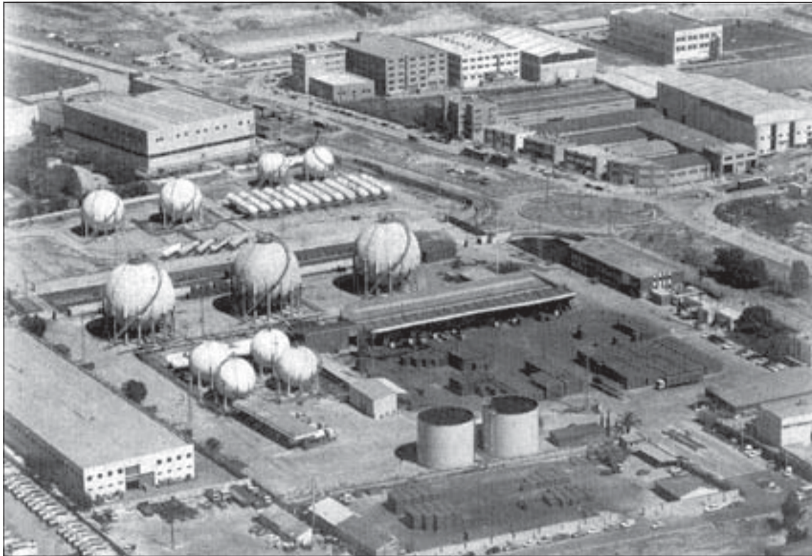
El Ayuntamiento y Repsol-Butano han firmado el convenio que desmantelará la planta