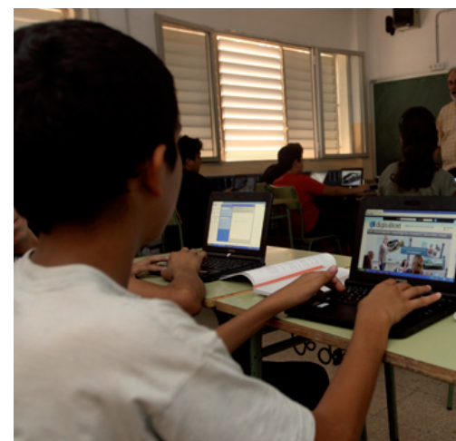
Aula digital de l'Institut Eduard Fontseré