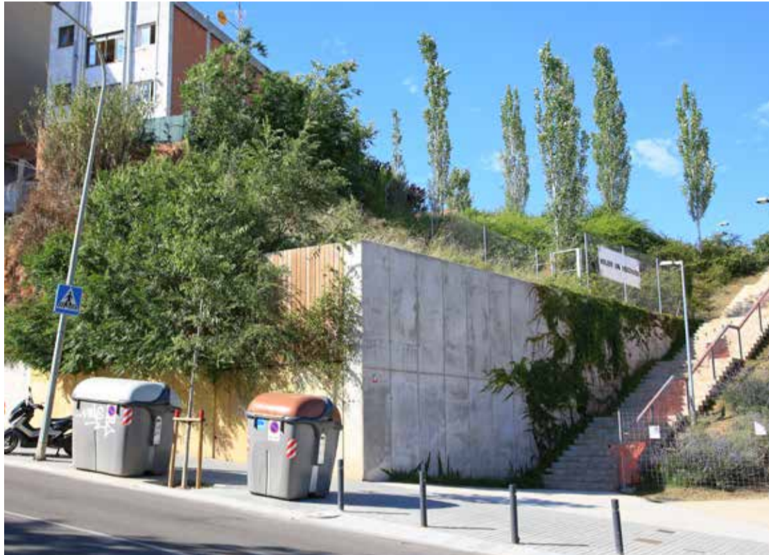
Escaleras en la Riera del Canyet que salvará el ascensor de Sanfeliu

Ambas calles se encuentran separadas por un desnivel de 9 metros y su conexión consiste en una escalera de cinco tramos y 60 escalones y otra, en el interior del parque, de cuatro tramos y 48 escalones. El nuevo ascensor, con capacidad para 11 personas, superará 9,3 metros de desnivel y tendrá dos paradas. La cabina será panorámica, tendrá iluminación led,