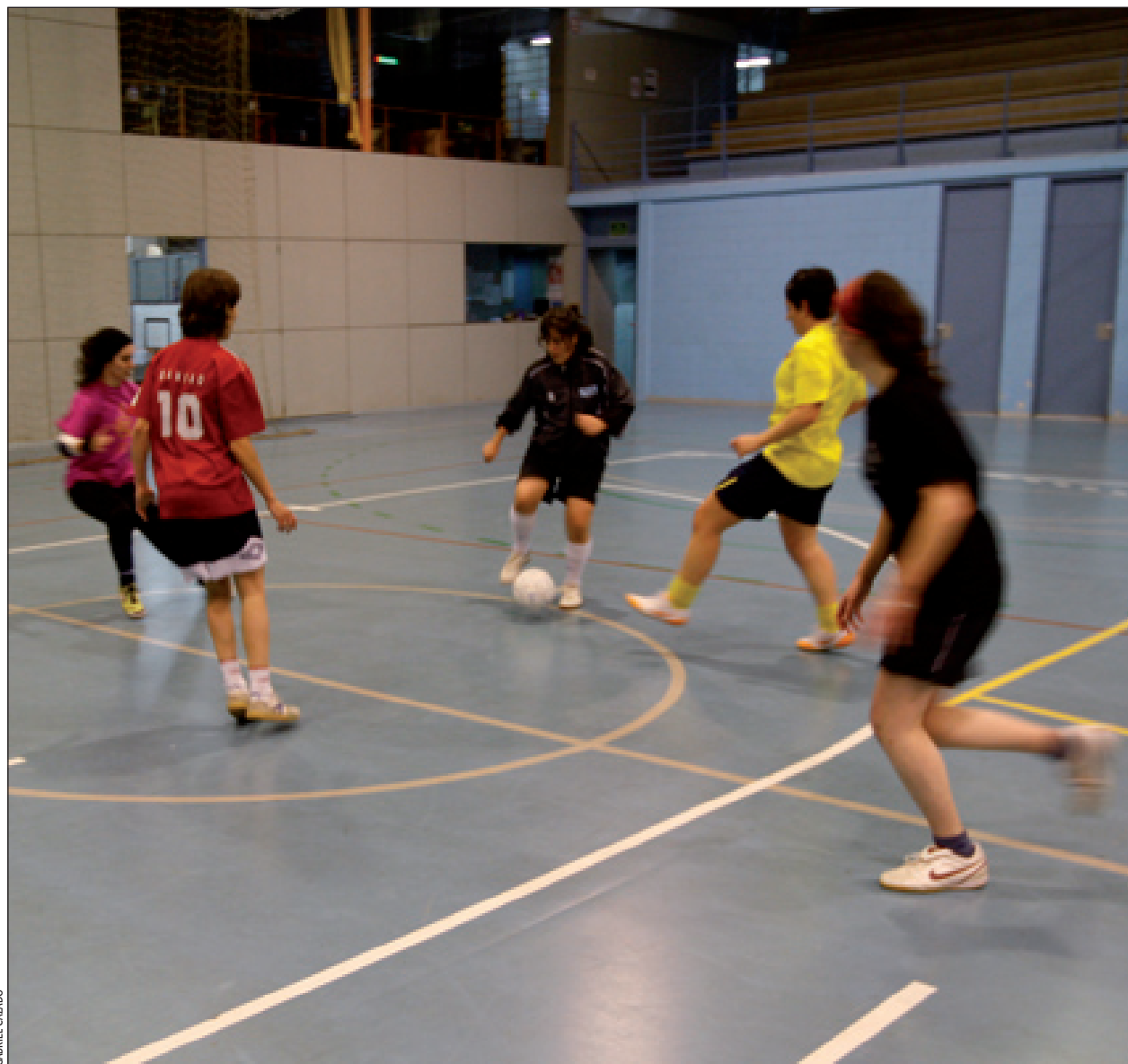
Sesión de entrenamiento del equipo femenino de fútbol sala del Bellsport

Recordemos que la parte femenina de la sección de fútbol sala del