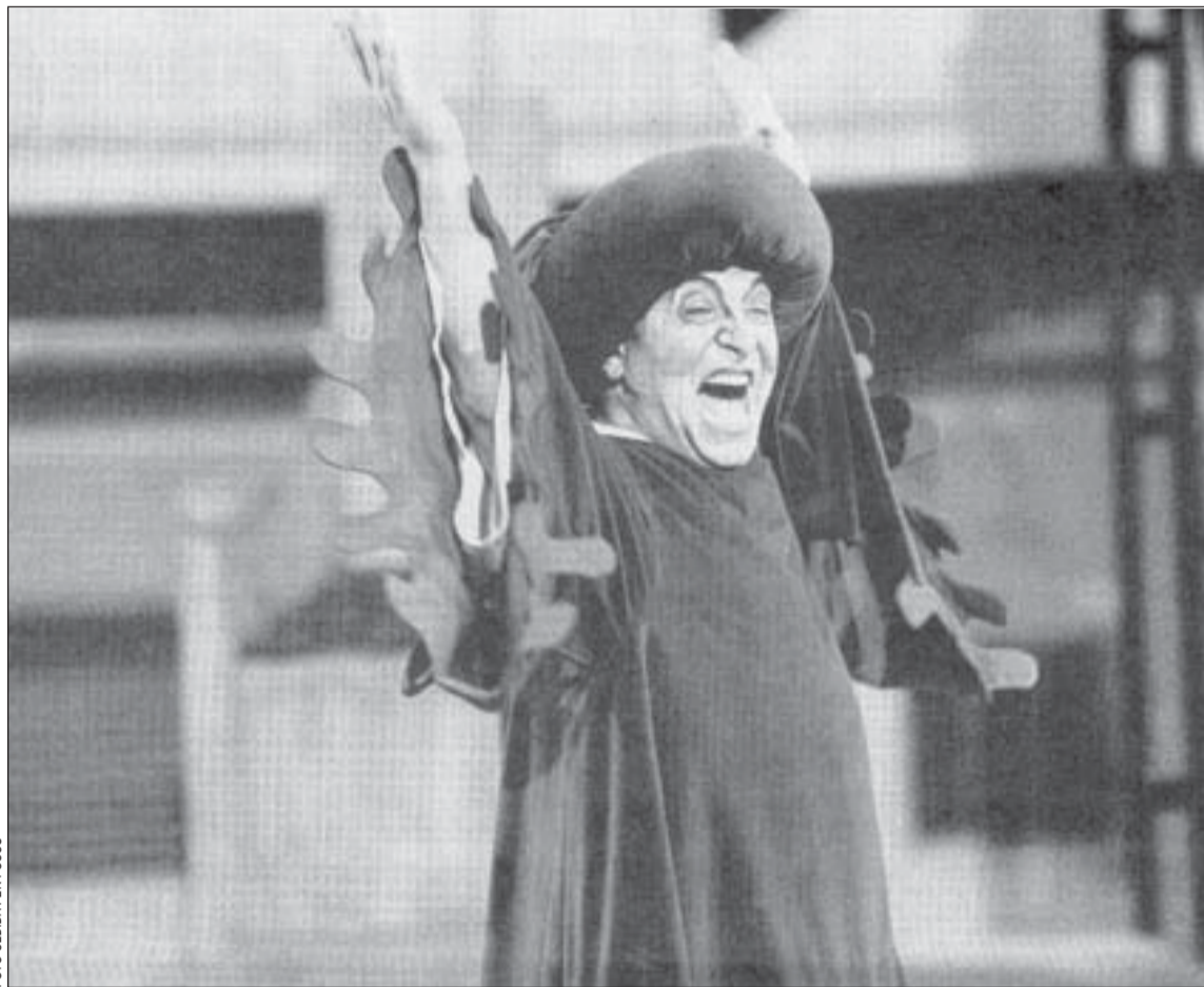
El retaule del flautista se representará en funciones para estudiantes del 14 al 2 de noviembre

Las expectativas son superar el número de espectadores del año pasado, 1.577 personas que asistieron a un total de 26 funciones.