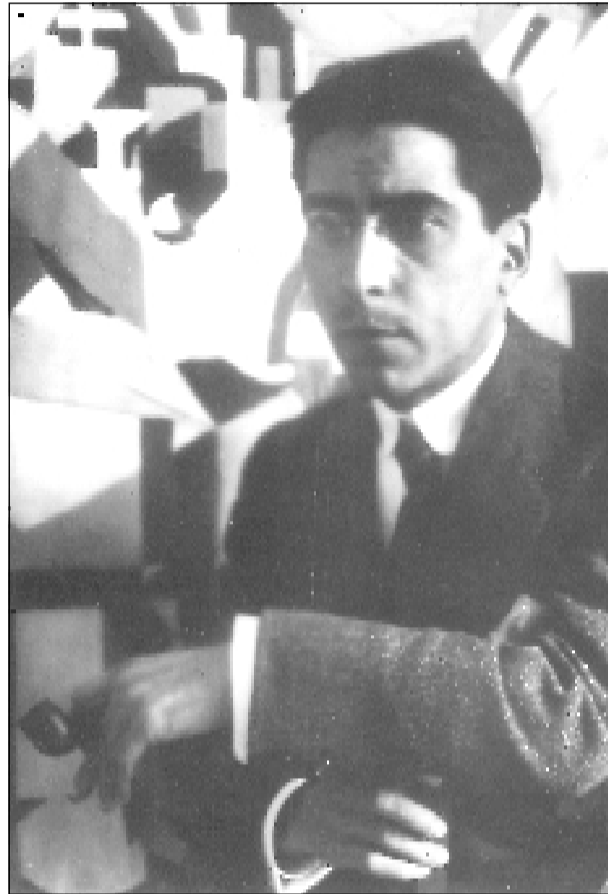
Dues de les fotografies de Rafael Barradas que es poden veure a l'exposició

« Gasch, García Lorca i Dalí van estar a la ciutat