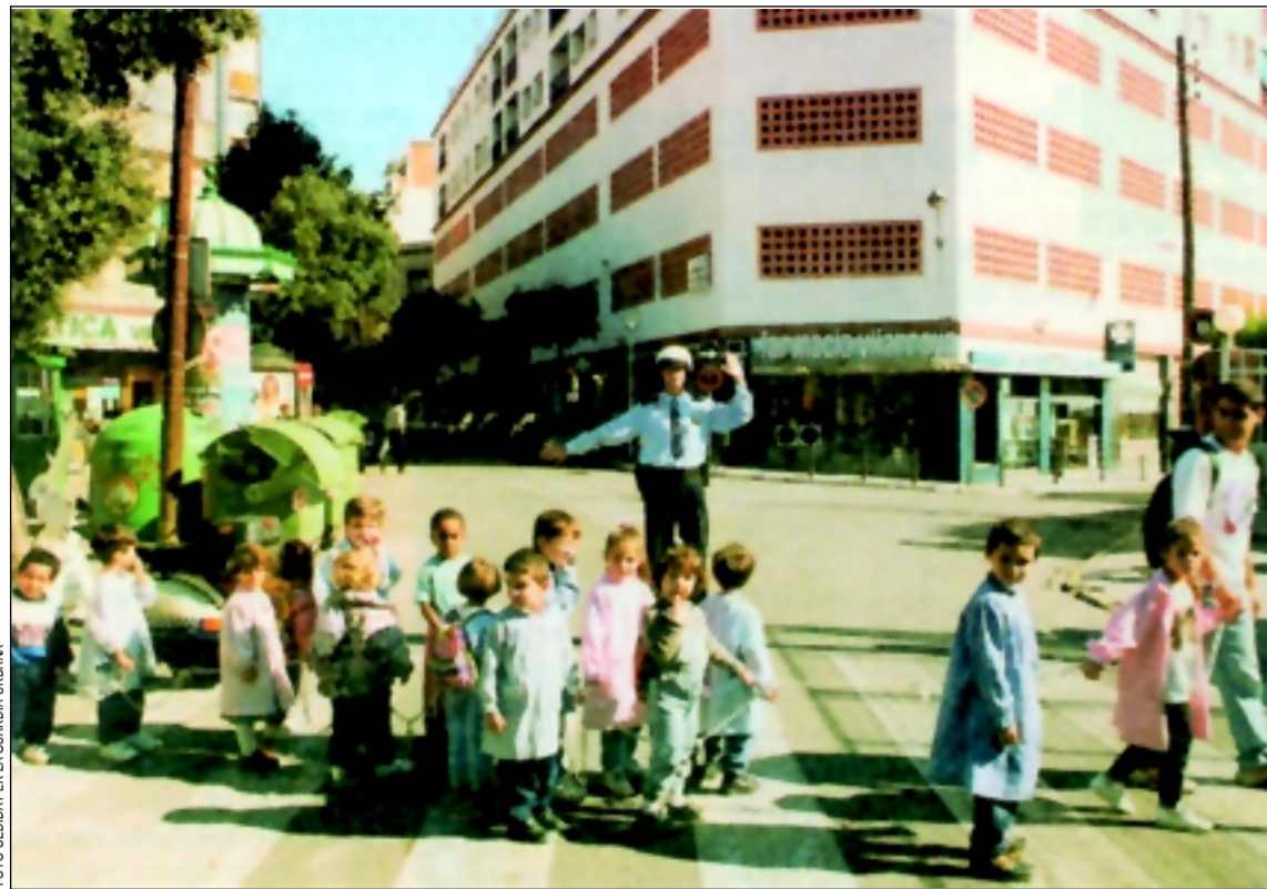
En 1997 la Guardia Urbana realizó 5.542 servicios de asistencia directa al ciudadano