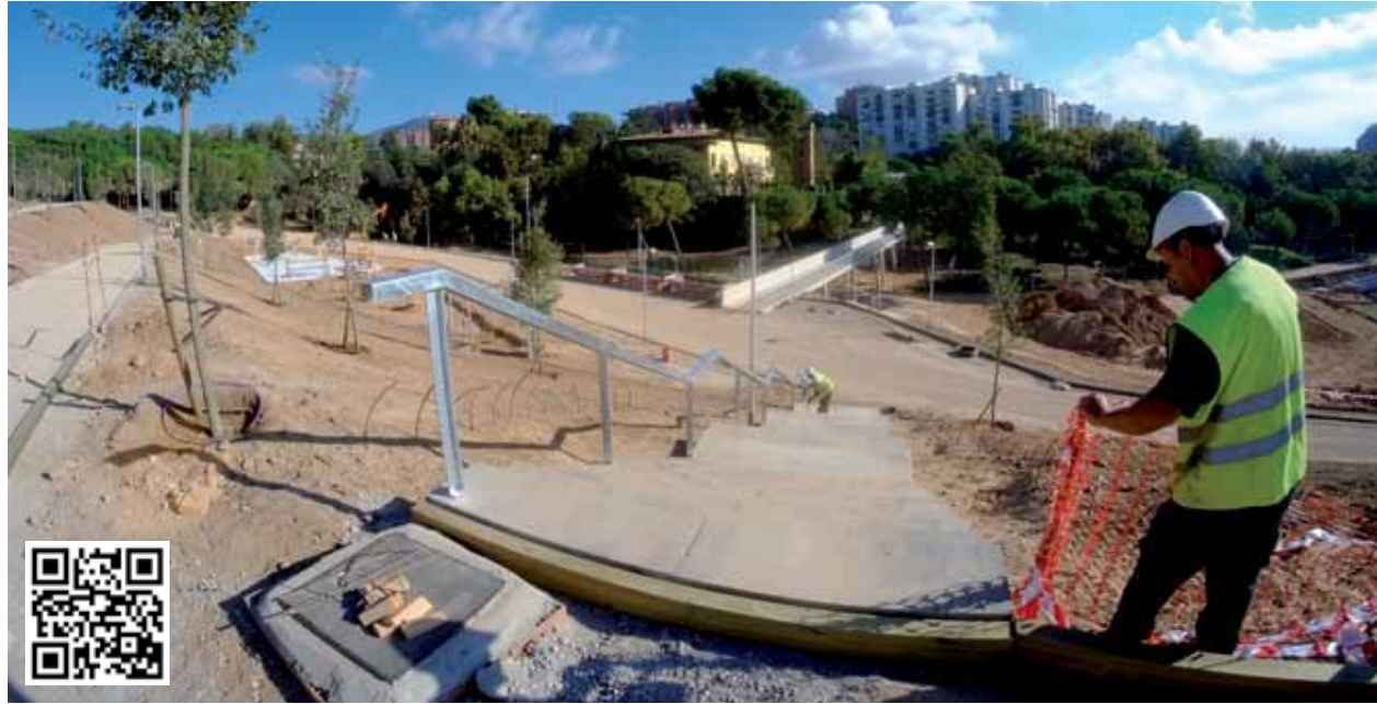
Treballs a la nova zona del parc i, al fons, la passera que connecta amb el Palauet

el gener quan es van realitzar les famílies afectades del camí de la Fontenta, han permès obrir un nou accés a peu pla des del barri de Sanfeliu, al carrer de Miquel Peiró i Victori. Per salvar el desnivell entre