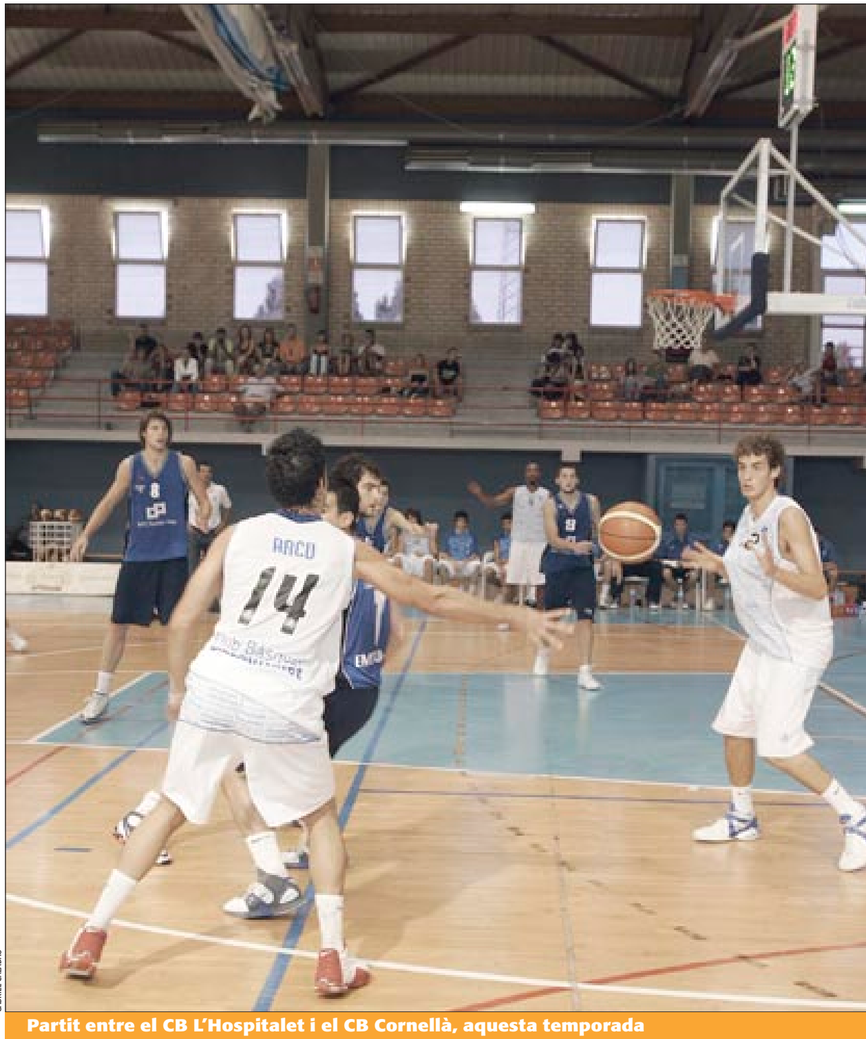
Partit entre el CB L'Hospitalet i el CB Cornellà, aquesta temporada

Cal destacar la faceta anotadora de l'equip: és un dels que més punts ha aconseguit en aquesta primera volta i és líder en assistències. La faceta defensiva, però, no ha estat tan brillant i, de fet, l'equip ha estat un xic irregular en el decurs de la primera fase de la competició, encadenant sèries de victòries i de derrotes entre les quals destaca la de cinc derrotes consecutives (de la jornada 10 a la 14). L'objectiu de l'equip és acabar la fase regular entre els vuit primers i poder disputar la fase pel títol. # ENRIQUE GIL