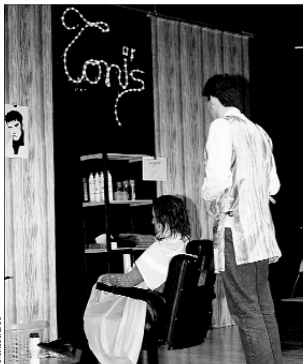
Imagen de la obra representada por el M. Xirgu