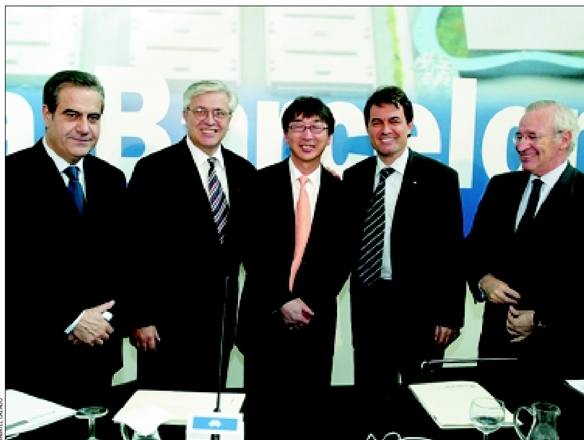
Los alcaldes Corbacho y Clos, el conseller Mas, Toyo Ito y Miquel Valls