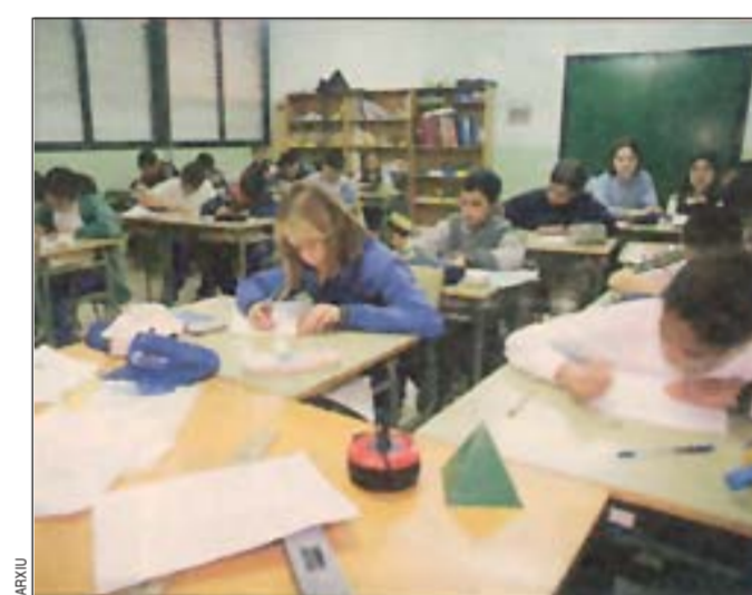
El nuevo curso se inaugurará el 15 de septiembre

Los Ciclos Formativos de Grado Medio, con mayor grado de especialización que la antigua FP1, permitirán al estudiante aprender un oficio para facilitarle una inserción laboral rápida. Aunque la duración de las especialidades -ver gráfico- es variable, las prácticas en empresas son obligatorias. Estos ciclos están abiertos además a estudiantes suspendidos en los nuevos bachilleratos. Tanto al ciclo medio como al superior, podrán acceder personas mayores de 18 años -en el primer caso- o mayores de 20, -en el segundo-, que sin haber cursado la ESO se sometan a una prueba de suficiencia.